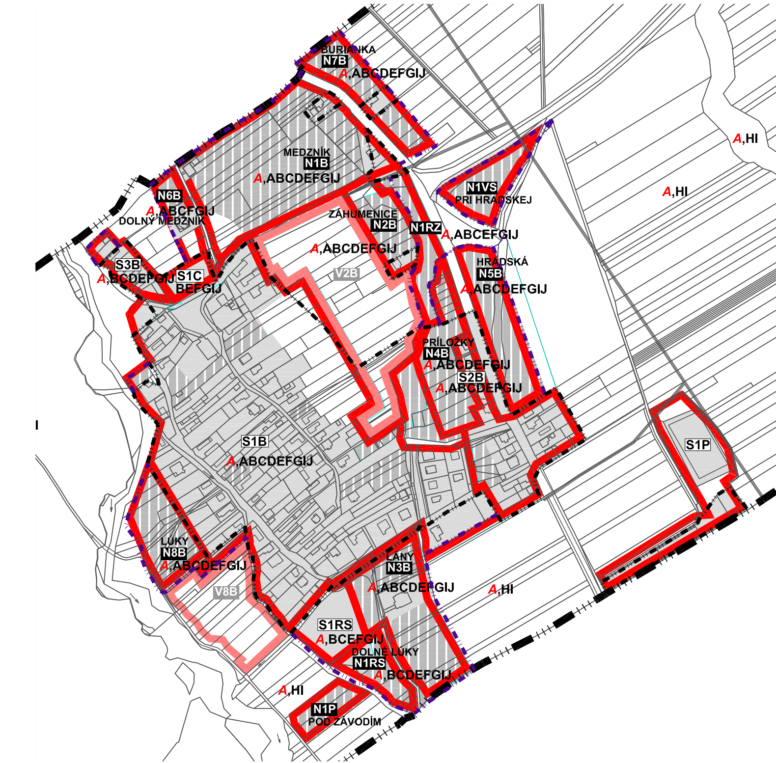
SCHEMA URBANISTICKÝCH BLOKOV

poznámka: obložnosť 1 RD (celoslovenský priemer) = 3,1 * odhad kapacity, spracovanie bude v následnej podrobnejšej dokumentácii na základe konkrétneho investičného zámery v medziach regulatívov stanovených v záväznej časti ** súčasť bilancii jestvujúceho stabilizovaného územia